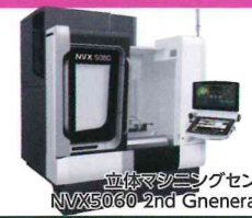
立形マシニングセンタ/ NXV5060 2nd Generation