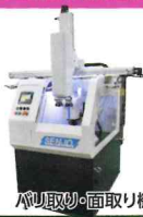
バリ取り・回転機/PLC-201