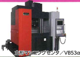
立形マシニングセンタ/VB53α