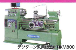
デジタートン汎用旋盤/HKM800