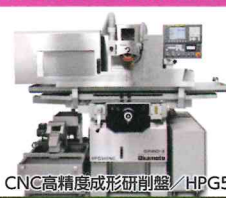
CNC高精度成形研削盤/HPG500NC