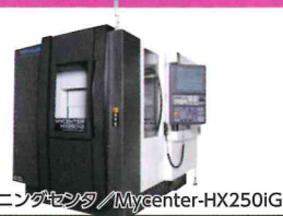
横型マシニングセンタ/Mycenter-HX250IG