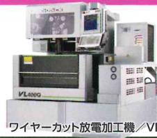
ワイヤーカット放電加工機/VL400Q