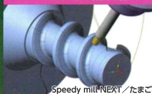
Speedy mill ® NEXT/たまごWin