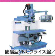
簡易型CNCフライス盤/AN-SRN