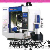
コンパクトマシニングセンタ/ SPEEDIO S306×2+BV7-80